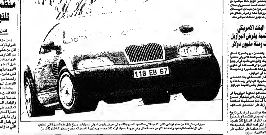
سيارة بوليتا 118 من مصنع فاغن الألمانية التي استحوذ عليها القاطن في معرض بوليس الدولي للسيارات. ويبلغ طول هذه السيارة التي تحتوي على كل الميزات الرياضية والأمنيات على خمسة أمتار، وهي مزودة بمحرك 4000 سي سي وبتسارع 0-100 في 12 ثانية.